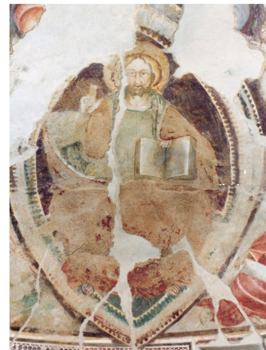
La Majestas Domini (sec. XV) nel catino absidale di Santa Margherita

La leggenda vuole che la fanciulla fosse originaria di Antiochia, figlia di un certo Edesimo, prete pagano. Orfana di madre, fu affidata ad una nutrice cristiana che viveva in campagna e che la convertì al cristianesimo. All'età di quindici anni (si era all'epoca delle persecuzioni di Diocleziano e Massimiano), mentre un giorno, assieme ad altre fanciulle accudiva al gregge di pecore della sua nutrice, Margherita fu vista da Olibrio, governatore della provincia, che viaggiava verso Antiochia. Questi, folgorato dalla bellezza della giovinetta, volle prenderla in moglie, convertendola alla fede pagana. Nonostante le più allettanti promesse, seguite da terribili minacce, la fanciulla rifiutò, non volendo abiurare alla propria fede. Olibrio la fece quindi sottoporre a feroci torture, la fece gettare in una oscura prigione ove le comparve il demonio in sembianze mostruose; Margherita se ne liberò con un gesto di croce. Vinto il demonio, la martire fu nuovamente tentata all'abiura dal governatore ma, essendosi rifiutata, fu sottoposta a nuovi tormenti. Da questi supplizi Margherita uscì indenne, grazie anche alla presenza dello Spirito Santo che la fanciulla aveva invocato onde fortificarla. Molti pagani che assistevano a tale prodigio credettero nel messaggio cristiano e si convertirono sì che, a punizione della loro abiura, furono fatti immediatamente giustiziare. Alla fine, anche la santa fu decapitata.